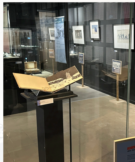
Exposition "Lucien Laby, un artiste dans la Grande Guerre"

Cette exposition propose de découvrir le parcours exceptionnel de Lucien Laby, à la fois soldat, médecin et artiste pendant la Première Guerre mondiale. À travers ses dessins et ses observations, il révèle un regard singulier sur le conflit et la vie des soldats. Pour prolonger l'expérience et rendre l'histoire accessible aux plus jeunes, le Département de l'Aisne a également publié un ouvrage jeunesse, La Grande Guerre de Lucien , mettant en valeur l'œuvre de l'artiste.