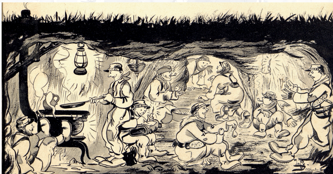
Dessin de Lucien LABY, Page 28

Cet ouvrage rassemble plus de 80 dessins de Lucien Laby, choisis pour leur expressivité, leurs couleurs et leur légèreté. À travers ces images, les enfants découvrent la vie quotidienne de Laby pendant la Grande Guerre. Les dessins, lumineux et humains, contrastent avec la dureté du conflit et permettent d'aborder cette période historique de manière douce et accessible.