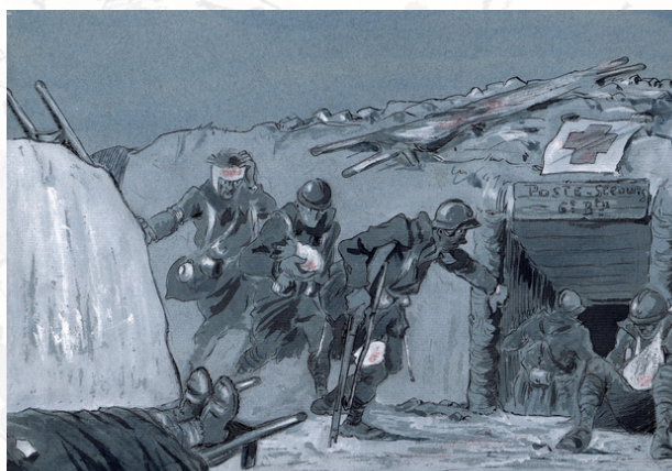
La Grande Guerre de Lucien, Page 50